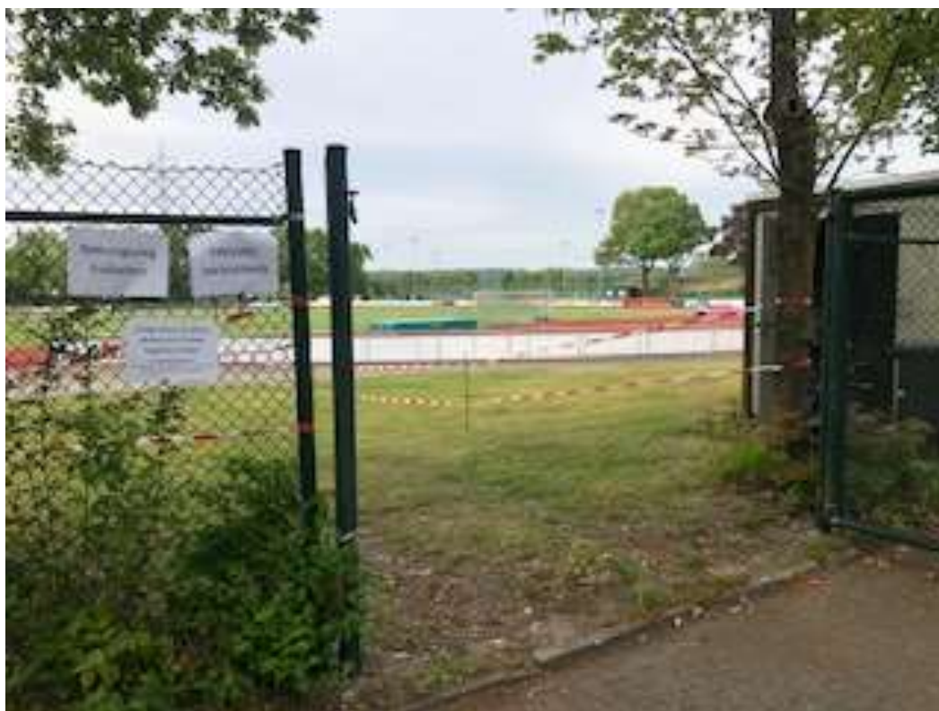
Bild 2, Fahrradstellplatz Leichtathletik/ Gesundheitssport/ Schulsport: